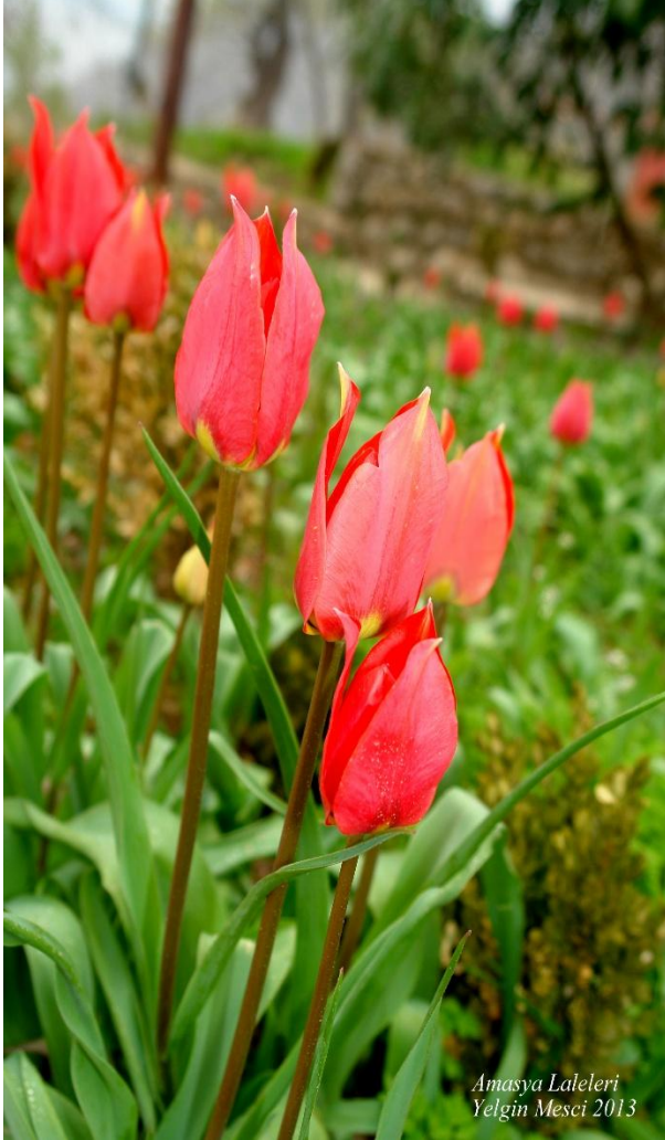
Amasya Laleleri Yelgin Mesci 2013