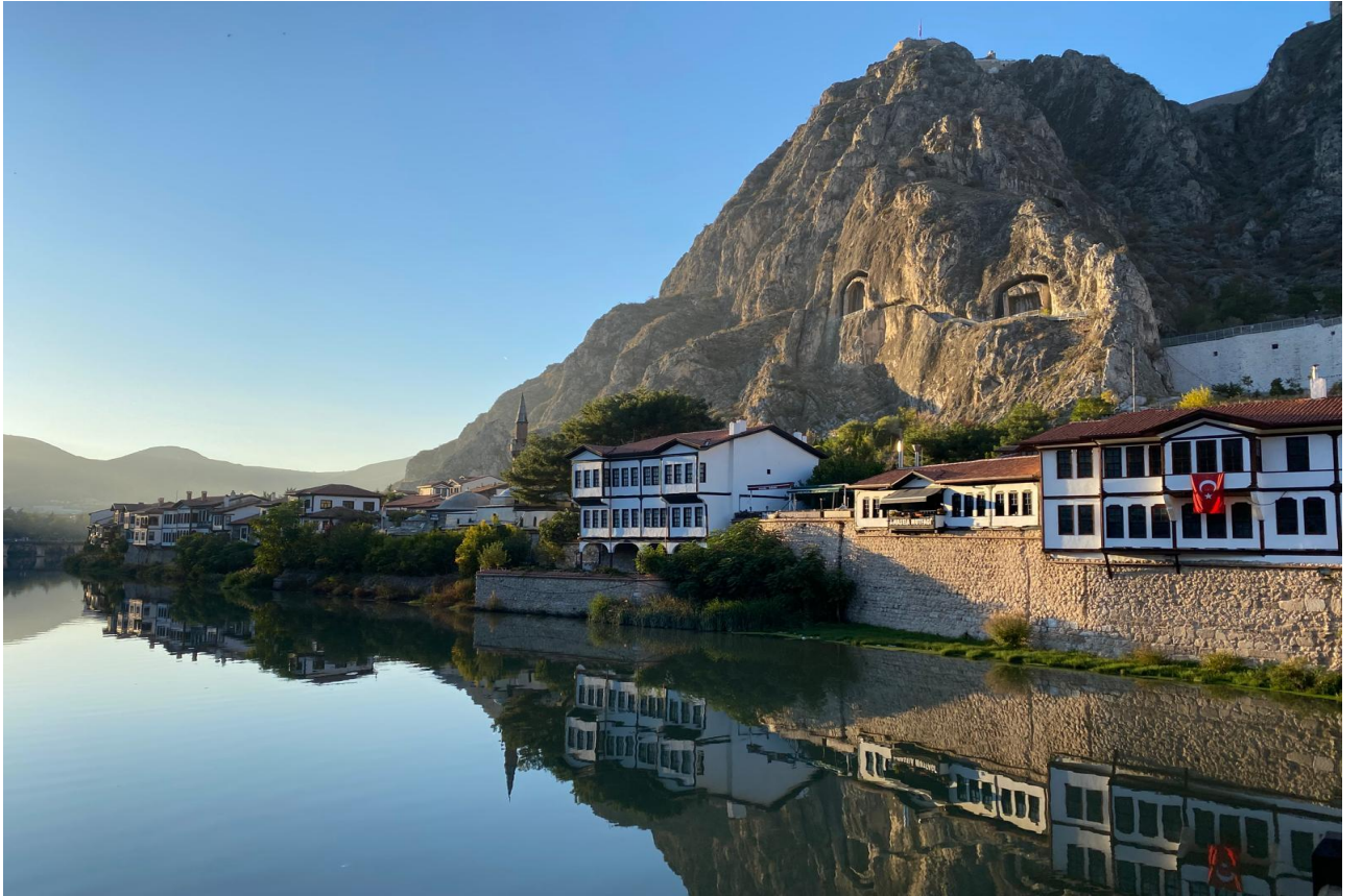
Fotoğraf 4. Amasya Yeşilirmak-Yalıboyu ve Harşena Dağı. Yelgin Arkoç Mesci

Anadolu'nun kaybolmuş veya tehlike altındaki türlerini araştırma ve yeniden kazandırma projelerini yürüten İstanbul'daki Nezahat Gökyiğit Botanik Bahçesi (NGBB) 2015 yılında bir çalışma başlatarak Amasya'nın yitik lalesi Tulipa Spengeri Baker 'ı Kew Gardens 'dan satın alarak kendi botanik parkında yeniden üretmiş. Tabi bu çalışma en az bir beş yıllık çabayı gerektirmiş. Sonrasında 2022 yılında Merzifon'da gönüllülerden oluşan kişiler NGBB'nden alınan bu lale soğanlarıyla TEMA bahçesinde deneme dikimleri yapmışlar. Dikilen lale soğanları bir yıl sonra çiçek açmış.