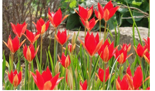
Fotoğraf 6. Tulipa Spengeri Baker. Royal Botanic Gardens-Kew-Londra

Şimdi yine Mart ayı gelecek, yani lale zamanı!..